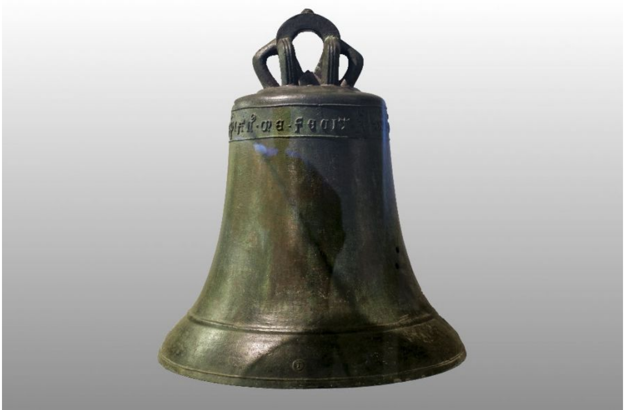
Oudste gesigeneerde klok in Nederland.

In Nederland kwam de luidklok pas toen het Christendom zijn intrede deed. Deze klokken hadden absoluut niet het geluid wat wij nu kennen. Het waren gewoon klokvormige voorwerpen met een geluid. De oudste klok van Nederland hangt, voor zover we nu weten, in de Sint-Agathakerk in Oudega en dateert van ca. 1200 na Chr. De oudste gesigeneerde luidklok van Nederland die nu nog bestaat, bevindt zich sinds 1916 in het Rijksmuseum in Amsterdam. Hij is gemaakt rond 1285 en komt uit de eerste kerk van Hekelingen.