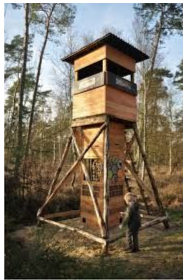
Hoogzit voor de jacht