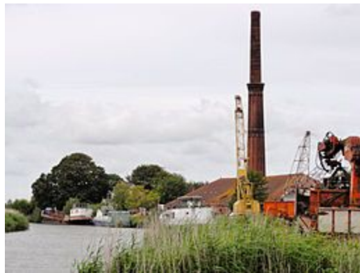
Toren steenfabriek Oostrum/Dokkum