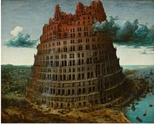
Toren van Babel/Pieter Bruegel, 1563

Vanouds werden torens gebruikt voor militaire doeleinden. Denk aan de verdedigingstorens van kastelen. Maar ook kerktorens waren hiervoor geschikt. Doordat ze overal bovenuit staken konden ze goed gebruikt worden als uitzichttorens. Daarom waren (en zijn) de torens soms eigendom van de gemeente en niet van de kerk. De kerktorens waren in die tijd soms versterkt en verdedigbaar en omdat ze zo sterk en robuust waren, werden belangrijke zaken in de toren opgeborgen. Werden de torens dus gebruikt als opslagplaats.