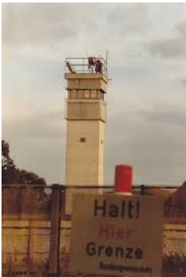
Wachttoren Oost Duitsland