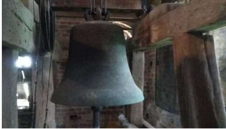
Luidklok in Ferwerd.