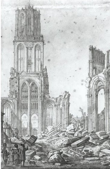
Tekening: Herman Saftleven

Kerktorens zijn vaak gebouwd met een andere reden dan wij nu denken. Zo kon een toren als schuilplaats dienen bij overstromingen of als uitkijktoren. In de toren van de Grote Kerk in Breda zaten eeuwenlang 2 bedsteden voor de wakers die in de gaten hielden of er ergens brand was of er een vijand aankwam. Zij woonden dus in de toren en luidden de klok als het nodig was. De toren van Holwerd deed dienst als vuurtoren (Holwerd lag toen nog aan zee), gevangenis, bergruimte voor defensie, tolhuis en misschien wel voor nog veel meer zaken. Torens waren ook belangrijk om een route aan te geven. In die tijd hadden ze natuurlijk nog geen echte wegen, wegwijzers, navigatie etc en aan een toren kon je zien dat daar een dorp, stad of nederzetting was. De klok op de toren liet zien hoe laat het was. Wel handig in een tijd waar bijna niemand over een horloge beschikte. Bovendien was de tijd niet overal gelijk. Zo kon het in Dokkum bijvoorbeeld vijf minuten vroeger zijn dan in Kollum of Ferwerd. Een gelijke tijd werd pas ingevoerd toen er openbaar vervoer kwam. De landelijke tijd zoals we die nu kennen werd pas ingevoerd toen de spoorwegen kwam.