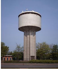
Watertoren in Dokkum. Architect: J.J.M. Vegter en gebouwd in 1958

gebieden waar ze een netwerk vormden om bosbranden te ontdekken. Bijna alle brandtorens zijn afgebroken toen er vliegtuigen kwamen. In onze nieuwe gemeente staan onder andere de volgende torens: kerktorens, schoorstenen van (oude) fabrieken, watertorens (Dokkum en Schiermonnikoog) en voor zendmasten voor mobiel en tv.