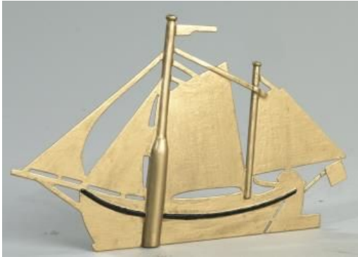
Replica van de windwijzer van de kerktoren van Paesens: een zeesnik. Bron: Maritiemdigitaal.nl

Bron: https://nl.wikipedia.org/wiki/Windhiaan