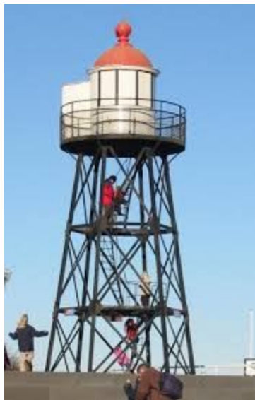
Vuurtoren als uitkijktoren